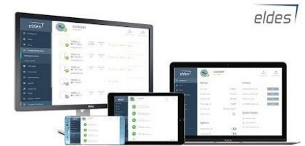
Eldes Utility Tool: vartotojų konfigūravimas